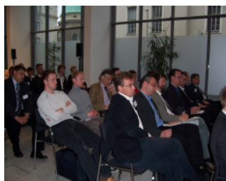
Ganz Ohr: Publikum in der Repräsentanz der Telekom

Wie fair ist die steuerliche Bevorzugung des Flugverkehrs, und wie lange hält sie noch an? Die Frage nach möglichen Abgaben und Steuern