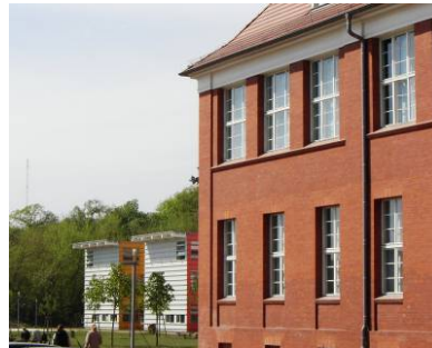
Die TFH Wildau ist mit 3500 Studierenden die größte Fachhochschule im Land Brandenburg. Der Campus am Südostrand von Berlin vereint Tradition und Moderne.